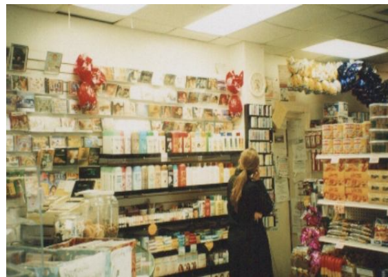
Las fotos 3 y 4 sacaron por Assis en 2001: Comercio brasileño en los E.E.U.U.

Esta organización dispersada, pero con el modo brasileño, demuestra que, así como los migrantes establecidos ya, los brasileños están buscando para circular en busca de mejores condiciones de la vida que crean Brasis pequeño en la región de Boston, evidenciando una de las tendencias mundiales de la economía del globalizada: