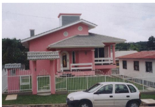
Las fotos 5 y 6 sacaron por Assis: Casa del migrante construida en Criciúma con el dinero del negocio del trabajo domestico en Boston

Para entender la perspectiva transnacional de la migración brasileña y como esto acontece en el flujo Criciúma-U.S.A. ella era necesaria analizar inicialmente como los migrantes catarinenses si identifican: como migrantes temporales, permanente, o si se encajonan en el perfil del transmigrante/migrante transnacional.